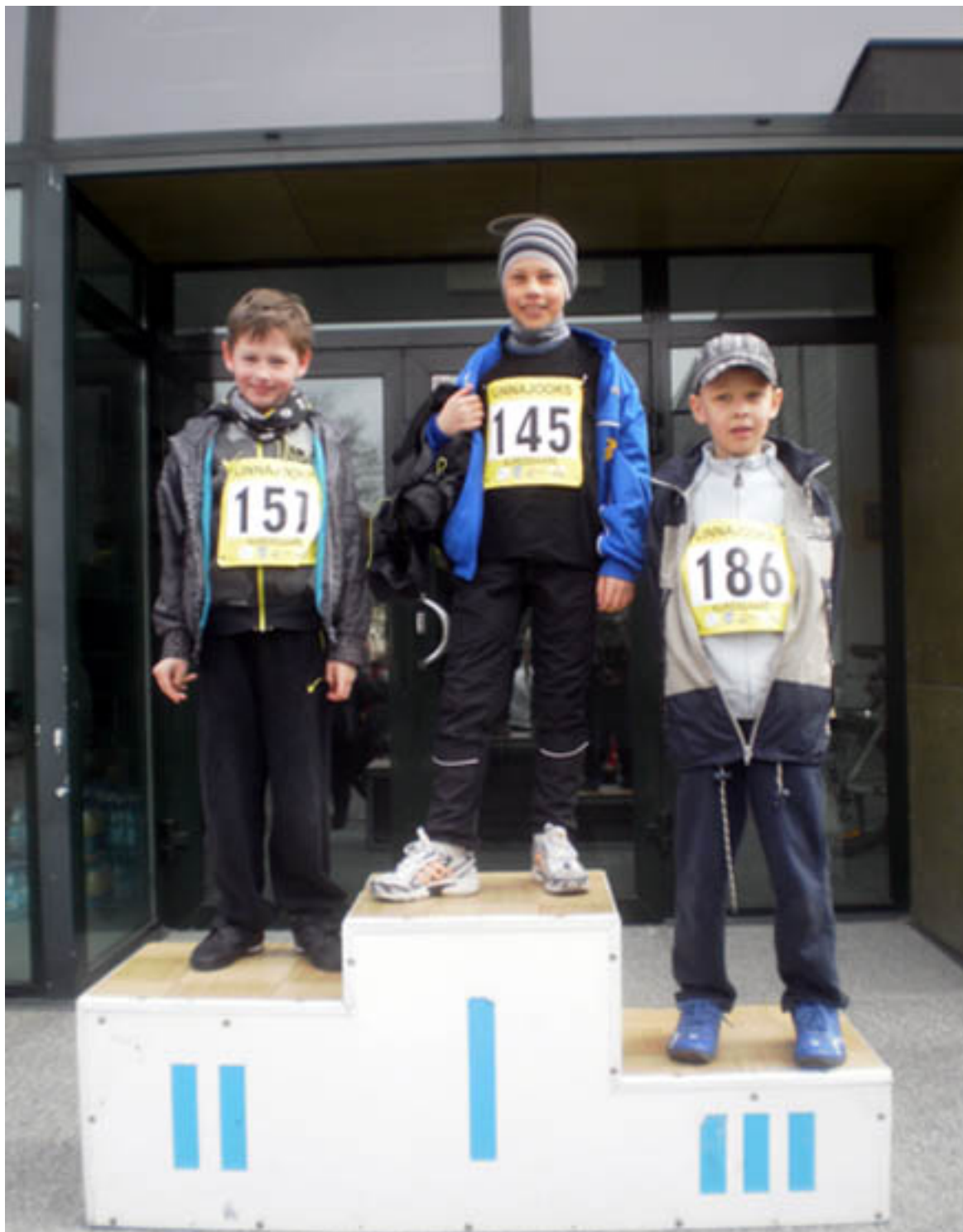
Parandage teksti! Kui te ei ole kindel, et see on õige, siis jätke tekst tühjaks. Kirjeldage, mis on toimunud ja millal, kus ja kuidas. Kui te ei ole kindel, et see on õige, siis jätke tekst tühjaks.