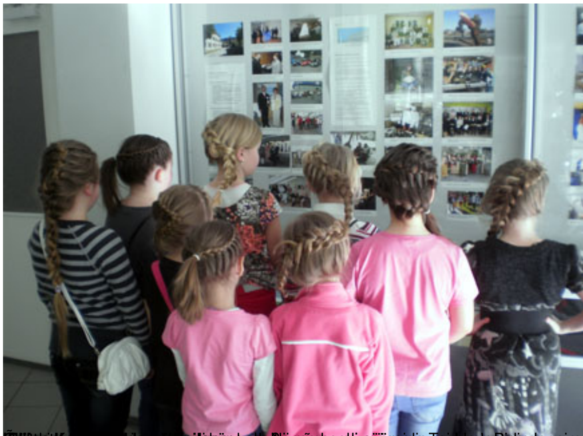
Õpilaste ja noorte koostöös valitud Eesti sõjajärgsete sõjavägede tsahistõid ja leppima ka