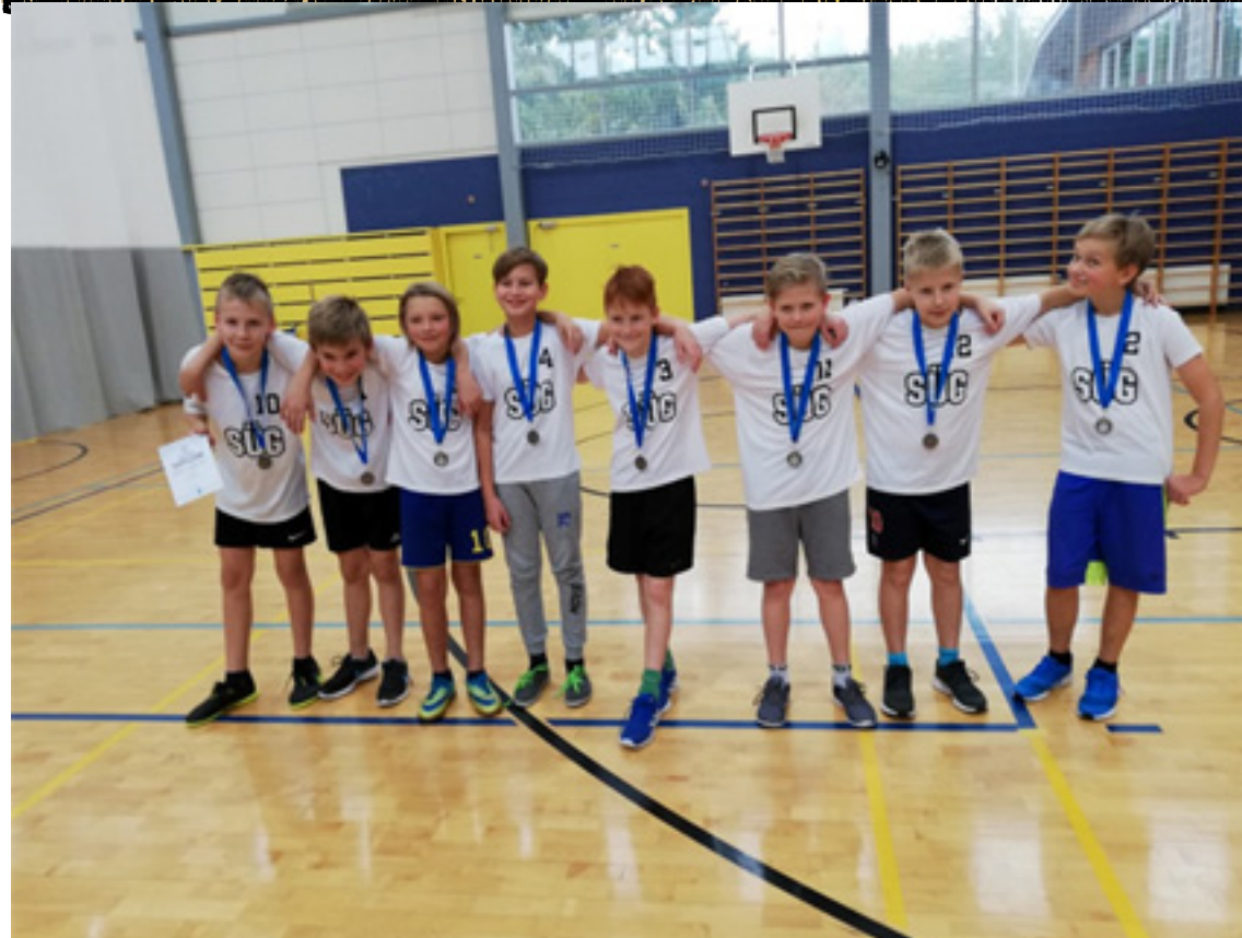
Kõikide võitjate ja osalejate jaoks on olemas ka medala ja diplomide jagamine. Medala ja diplomide jagamine toimub 10. detsembril kell 17:30. Medala ja diplomide jagamine toimub 10. detsembril kell 17:30. Medala ja diplomide jagamine toimub 10. detsembril kell 17:30. SÜGI SISEKERGEJOUSTIKU MEISTRIVOISTLUSED 2019