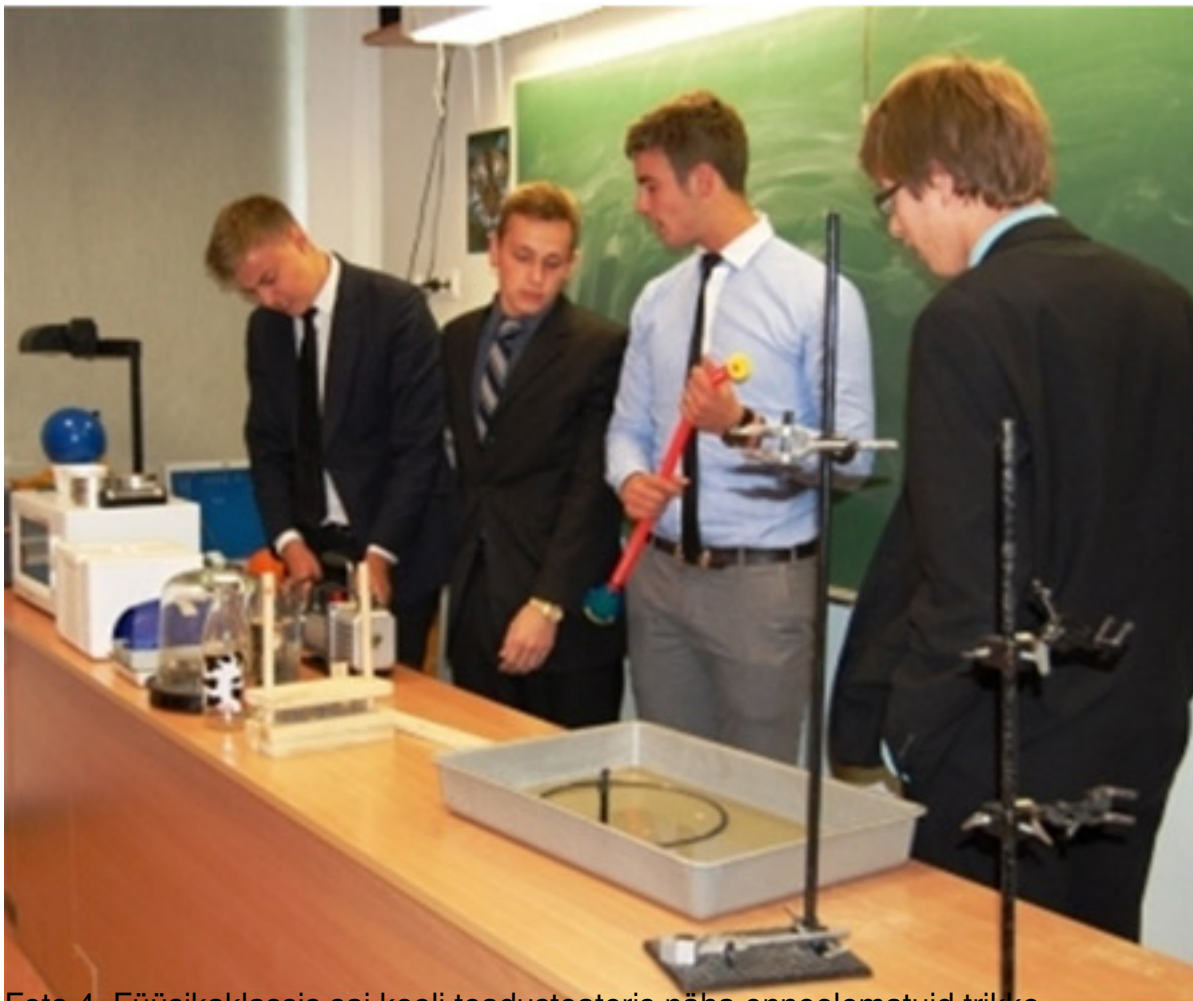
Foto 4. Füüsikaklassis sai kooli teadusteateris näha enneolematuid trikke.