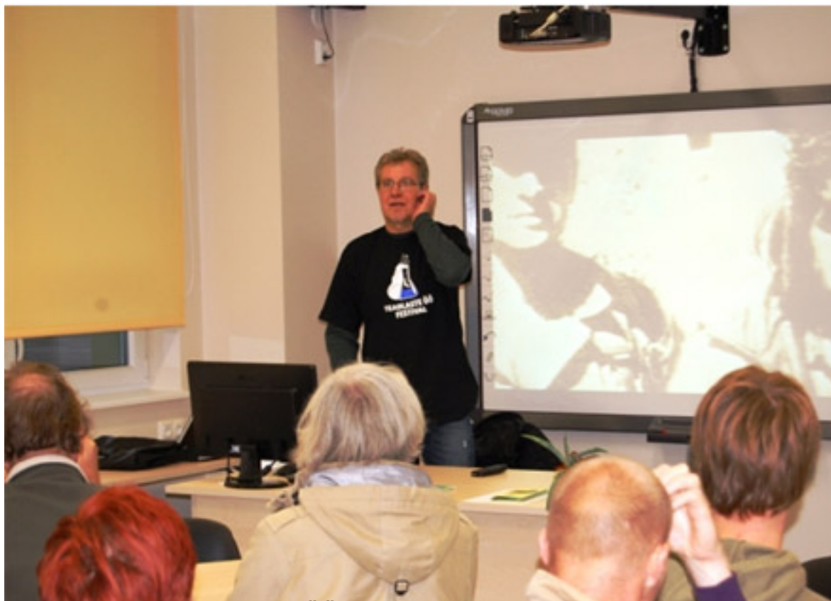
Rõõm ja rõõm, kuidas laste, õkoraalid ja valgega kommunismi ja natsionaalsotsialismi