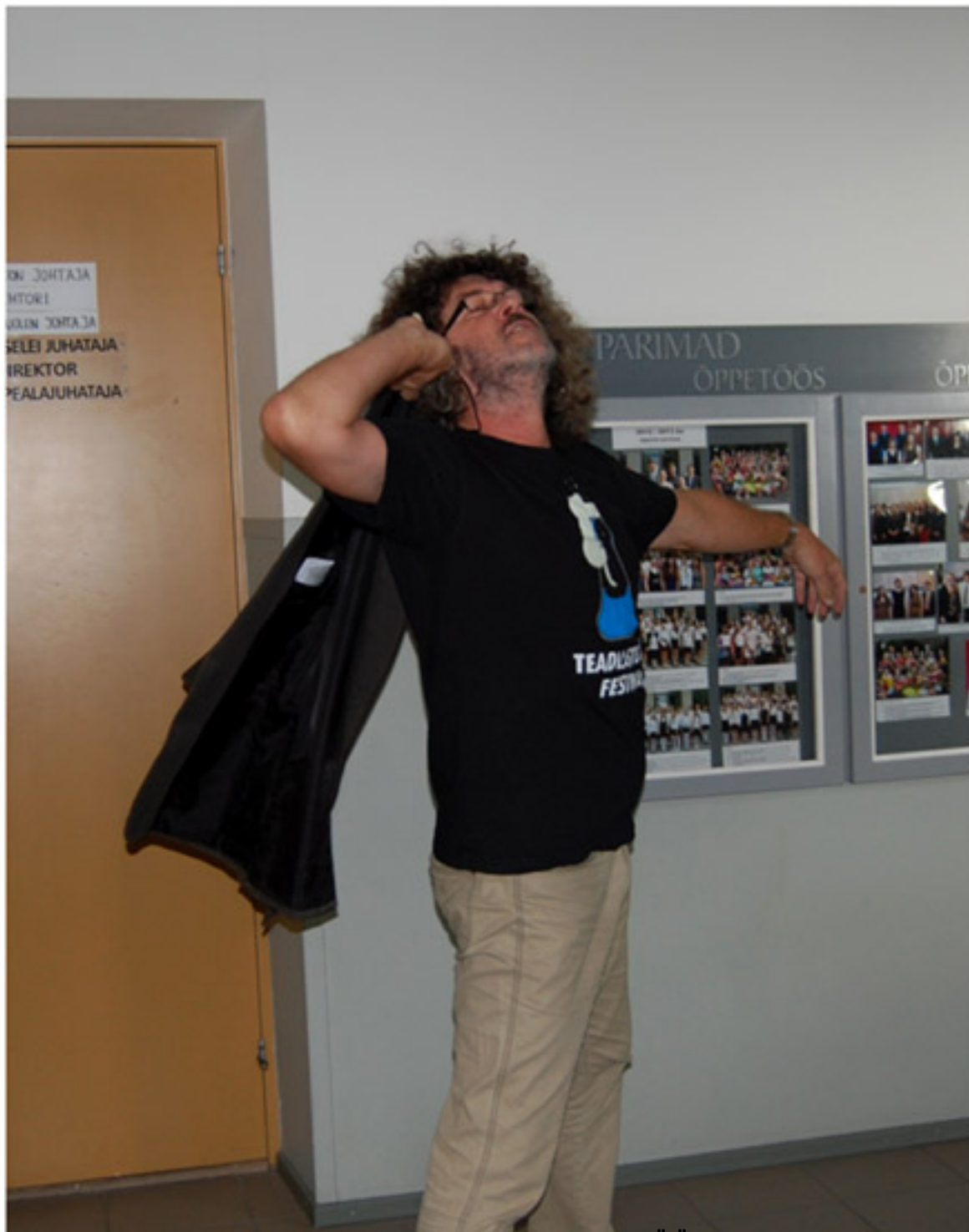
Foto 1. Kuna hommik on õhtust targem, siis Teadlaste ÖÖ algas meil juba hommikul.