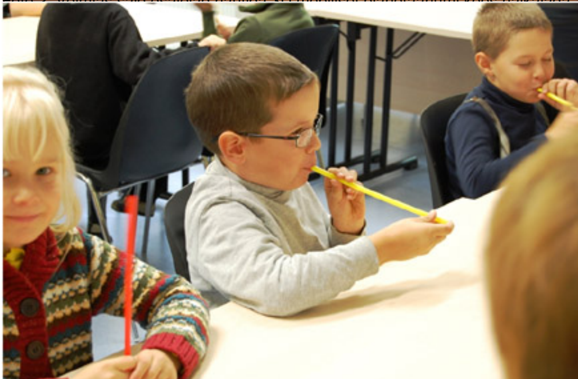
Foto 3. KHK-s said lasteaialapsed meisterdada kõrrepilli ja sellega ussi tantsitada.