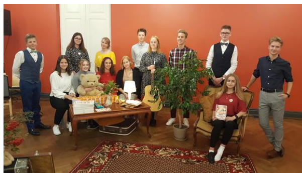
14-19aastaste vanusgrupis osalenud