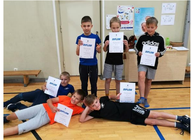
Võidukas poiste tiim „Valge“