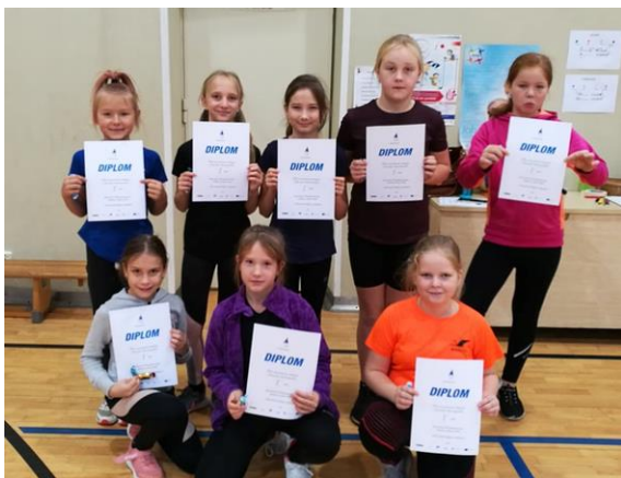
Võidu napsanud tüdrukute võistkond „Valge“