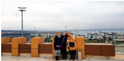
Rõõmsad eestlased Marmara mere kaldal