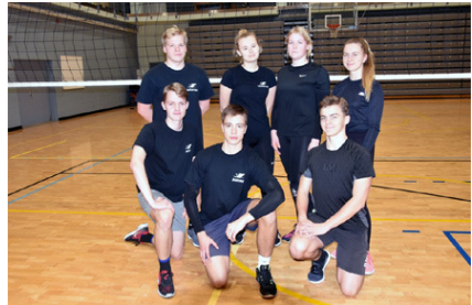
3. koha võistkond