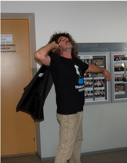
Foto 1. Kuna hommik on õhtust targem, siis Teadlaste ÕO algas meil juba hommikul.