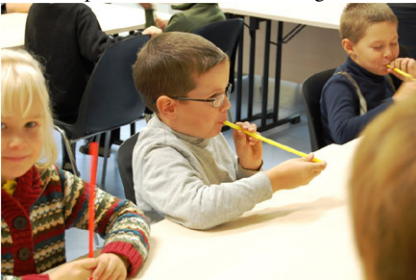
Foto 3. KHK-s said lasteaialapsed meisterdada kõrrepilli ja sellega ussi tantsitada.