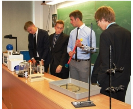
Foto 4. Füüsikaklassis sai kooli teadusteateris näha enneolematuid trikke.