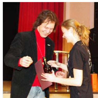
Eelmise aasta lemmikžüriiliige

Ma kuulsin jah enne, et ma pidin olema kõige rohkem kordi valitud. See on väga tore. Iseenesest ma olen endale lubanud seda, et ma ei ole alati olnud kõige viisakam tagasisidet andes. Ma olen olnud aus: olen mõelnud, et vahel liigagi aus. Kindlasti olen kogemata kellelegi haiget teinud. Aga ilmselt siis mingil määral eelistataksegi või oodatakse, et sa peegeldad sõnadega karmilt seda, mida näinud oled.