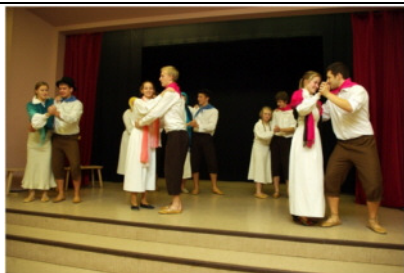
Lõputants „Süütu noorus“