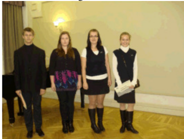
SÜGi esindus Lümandas