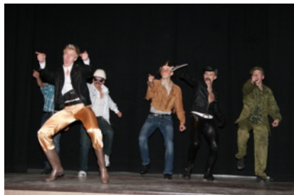
10c ja Village People

Aitäh kõigile osalejatele ja toredale žüriile. Täname meeldiva koostöö eest ka ajalehte Saarte Hääli. Suurimad tänusõnad Andreasele, kes käed ristas kõigist tehnilistest vahenditest maksimumi võttis, Laurile filmimise ning Henrile fotografeerimise eest.