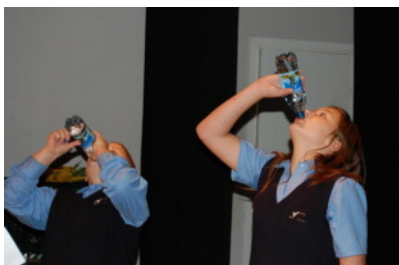
Vett kurgust alla kulistamas