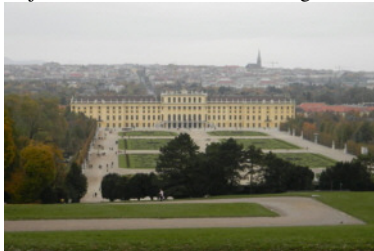
Siin elamise vastu poleks kellelgi vist midagi...