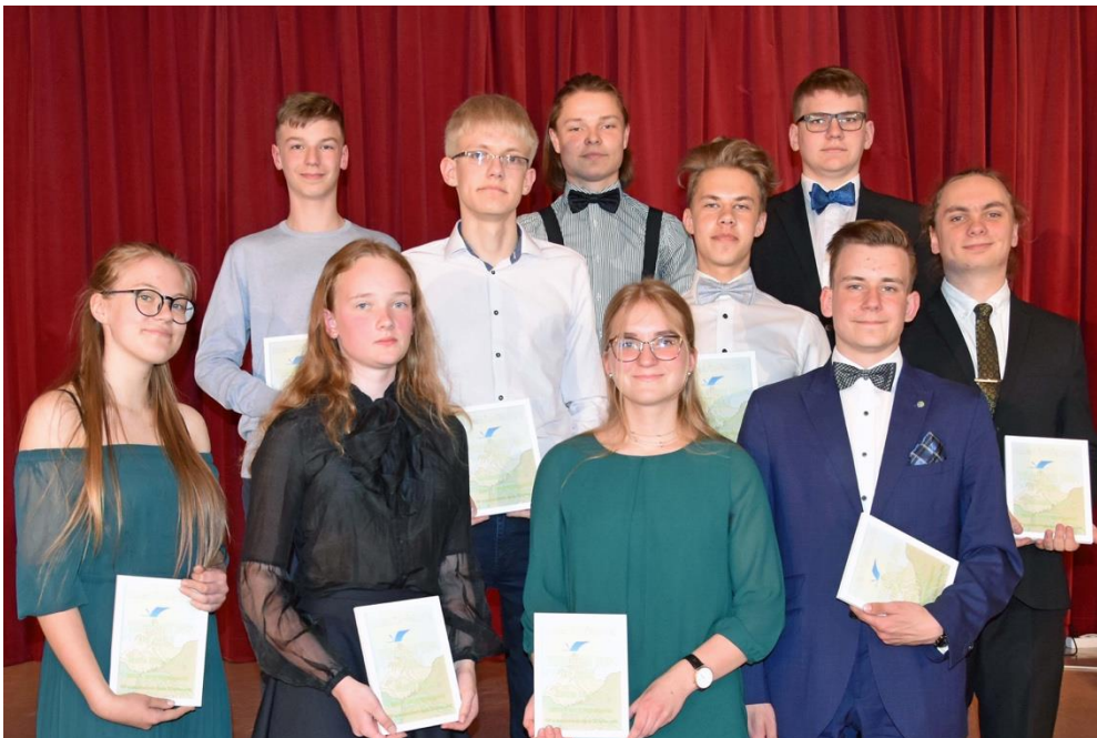
Fotol: TeadusTOP 10 õpilased