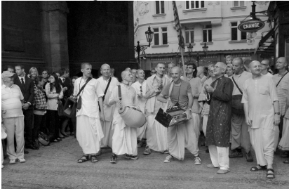
Laulev seltskond Prahás