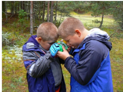
Noored loodusinimesed 4a-st

Me käisime jalgratastega Mändjalas. Alguses olime üsna aeglasel. Silla juures pidas meid kinni politsei. Nad vaatasid meie rattad üle ja küsisid juhilube. Teine peatus oli meil umbes 1-2 km kaugusel ristmikust. Seal puhkasime natuke. Siis hakkasime jälle sõitma. Jõudsimme ruttu Mändjalga.