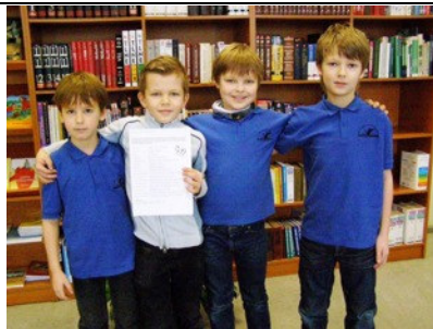
2b võidukas meeskond