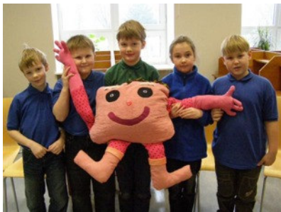
1b klassi õpilased raamatukogus