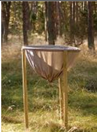
Selle „kausi“ sisse koguneb puudeokkaid, mille põhjal tehakse keskkonnanuuringuid

Laupäeva õhtul, kui tuul oli juba mõnusalt tõusnud, grillisime mere ääres head-paremat ning istusime seal päris pimedaski. Ööbisime saare keskel olevas bioloogiajaamas.