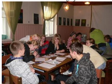
Katsed kaalumitraadiga pakkusid huvi

Laupäeva õhtul, kui tuul oli juba mõnusalt tõusnud, grillisime mere ääres head-paremat ning istusime seal päris pimedaski. Ööbisime saare keskel olevas bioloogiajaamas.