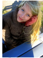
Äret Pea 10c